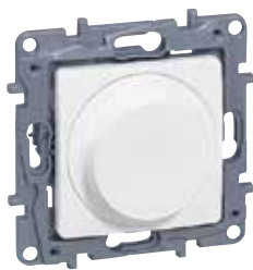
7 645 88

Οι μηχανισμοί παραδίδονται με πλακίδιο και βάση στήριξης. Δέχονται τα πλαίσια της σελ. 322 . Τοποθέτηση με βίδες ή νύχια.