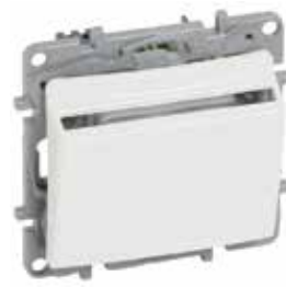
6 647 93

Οι μηχανισμοί παραδίδονται με πλακίδιο και βάση στήριξης. Δέχονται τα πλαίσια της σελ. 322 . Τοποθέτηση με βίδες ή νύχια.