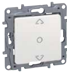
7 645 11

Οι μηχανισμοί παραδίδονται με πλακίδιο και βάση στήριξης. Δέχονται τα πλαίσια της σελ. 322 . Τοποθέτηση με βίδες ή νύχια.